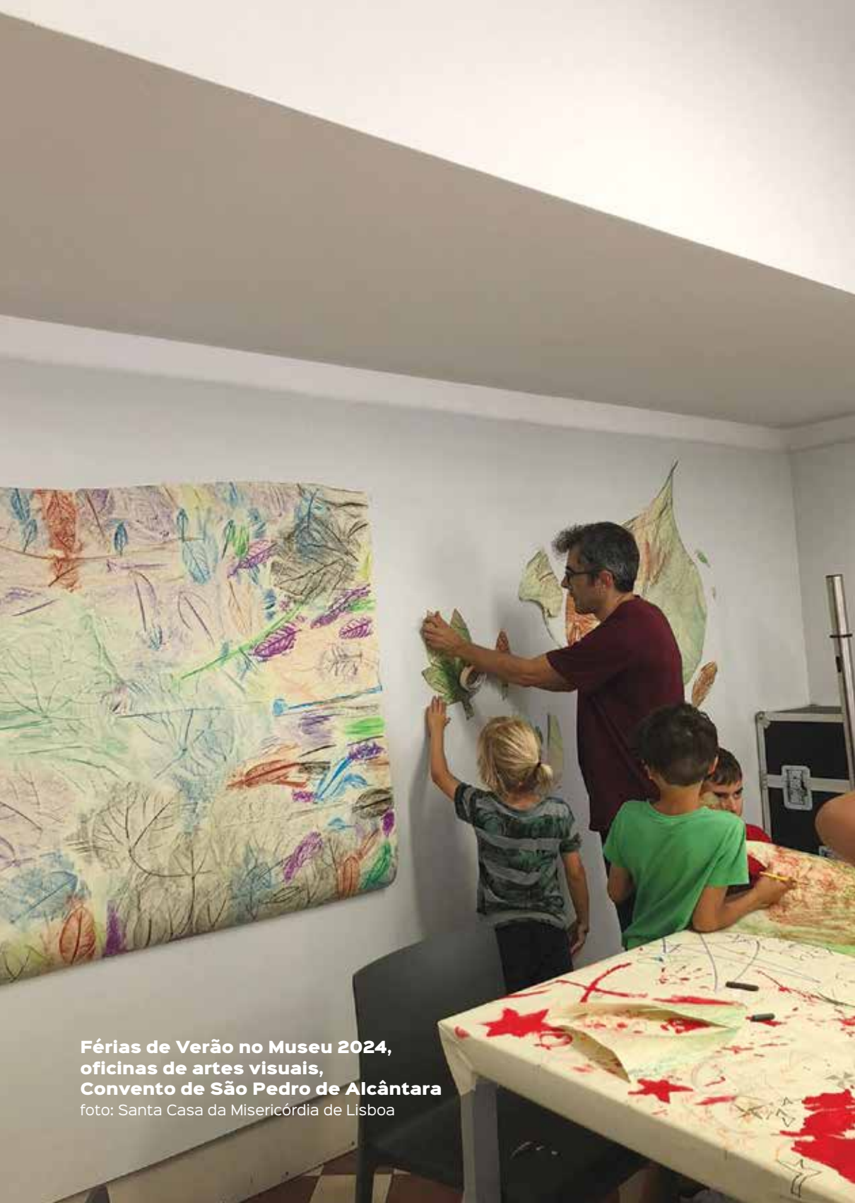
Férias de Verão no Museu 2024, oficinas de artes visuais, Convento de São Pedro de Alcântara