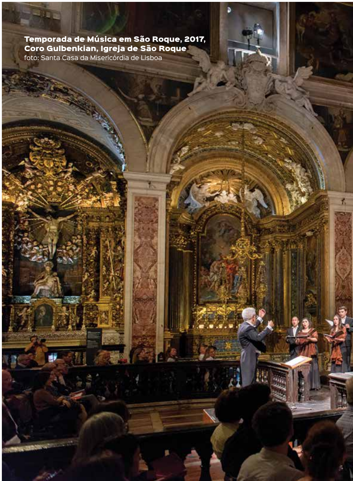
Temporada de Música em São Roque, 2017, Coro Gulbenkian, Igreja de São Roque